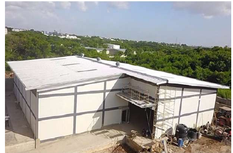
NAVE INDUSTRIAL PARA MANTENIMIENTO DE FLOTILLA DE VEHÍCULOS