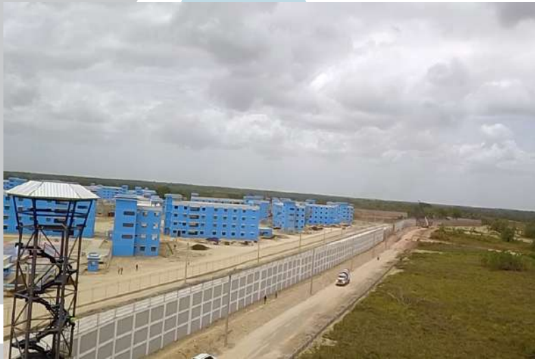
CONSTRUCCIÓN DE VERJA PERIMETRAL DE MÁXIMA SEGURIDAD DE 3.8KM DE LONGITUD CON ALTURA DE 8 METROS.